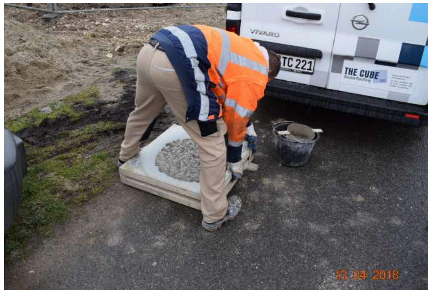
Recyclinghaus w Niemczech (proj. Cityforster)