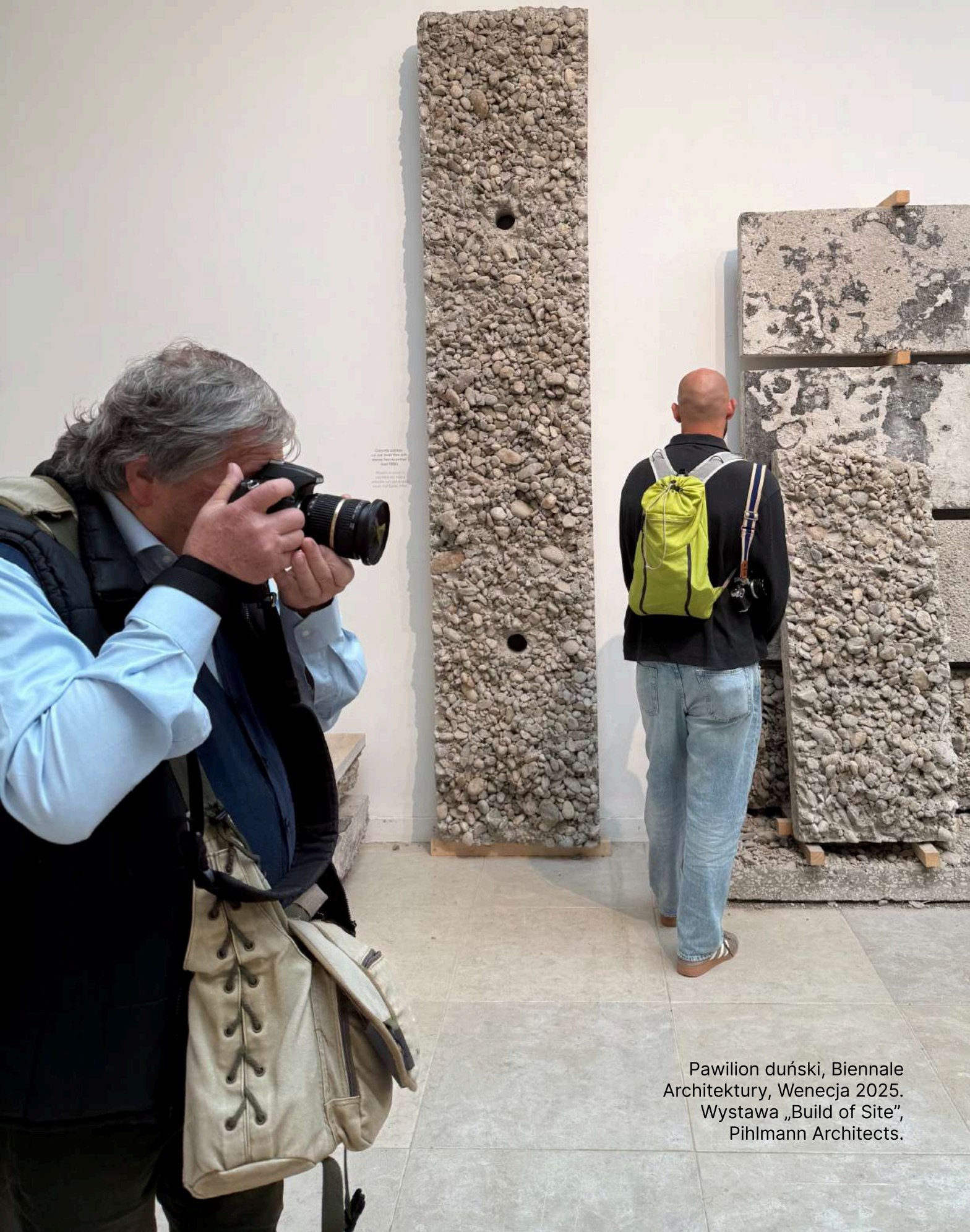
Pawilion duński, Biennale Architektury, Wenecja 2025. Wystawa „Build of Site”, Pihlmann Architects.